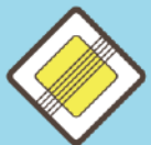
Конец главной дороги