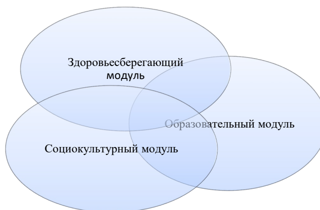
Рисунок 1. Схема взаимодействия модулей программы

С целью достижения максимального результата в течение всего основного этапа коллективы участников программы живут активной внутренней жизнью: проводят отрядные и межотрядные коллективно-творческие дела.